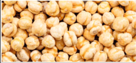
1 Numara ST 01-12